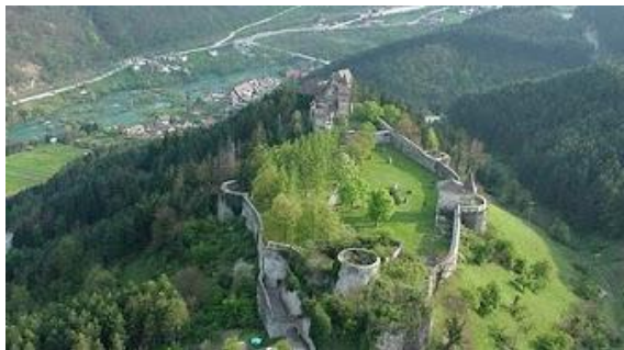
Sl. 2. Srednjovjekovni utvrđeni grad Ostrožac sa istoimenim podgrađem u kojem se nalazi i hotel, što sve skupa predstavlja turistički lokalitet i potencijalno turističko mjesto za razvoj tranzitnog turizma

Turističko mjesto je teritorijalna cjelina sa turističkim sadržajem koje čine nekoliko ključnih objekata za turiste koje ih posjećuju i u kojima se manifestuje sadržajan boravak turistima uz mogućnost upražnjavanja različitih aktivnosti vezanih za osnovne turističke resurse. Njih mogu činiti i historijski gradovi. Turističkim mjestima u Bosni i Hercegovini konkurišu brojna manja mjesta, koje ovom prilikom nećemo sve nabrajati. Za primjer može