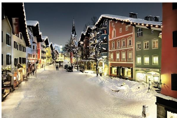
Sl. 4. Kibbil, turističko mjesto u Tirolskim Alpima sa svega 10 hiljada stanovnika. U vrijeme održavanja čuvenog spusta broj stanovnika se udesetostruči

U turističke centre ubrajaju se i centri vjerskog turizma, koji imaju trajnu vrijednost, a pojačano značajniju u vrijeme hodočasničkih manifestacija, kao što putovanja u Meku, Vatikan, Jerusalem i dr. Turistički centri mogu biti i oni koji razvijaju sezonski turistički