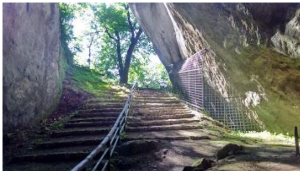
Sl. 1. Djevojačka pećina kod Kladnja nije samo speleološki lokalitet već i turistički lokalitet hodočašća

Turistički lokalitet tretira dio teritorijalne cjeline. Turistički lokalitet predstavljen je konkretnim turističkim identifikacionim elementom tj. određenim turističkim motivom, odnosno prostorno funkcionalnom individualnošću. To su objekti turističkog interesovanja kao što je npr. sedreni vodopadi: Kravice na Trebižatu, Martin Brod i Štrbački buk na Uni, Plivski na Plivi u Jajcu itd.