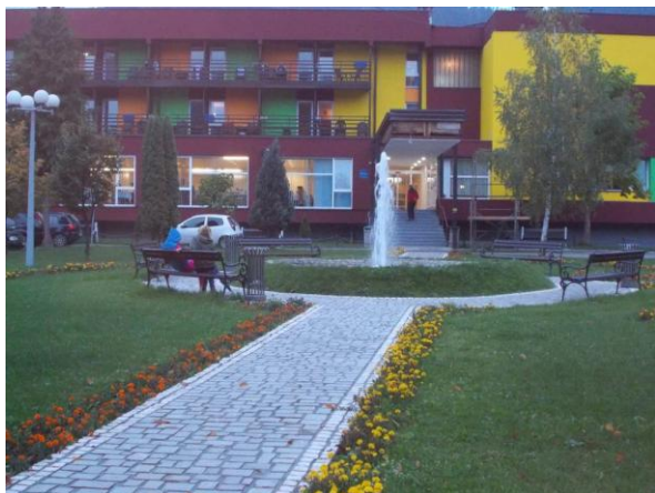
Sl. 3. Aquaterm u Olovo je turističko odredište zdravstveno-rekreativnog turizma

rketinške prezentacije, turističkih putokaza i turističkih smještajnih kapaciteta bit će zaobiđeno na bilo kojem turističkom koridoru. Kao primjer neiskorištenog turističkog mjesta je stari grad Ostrožac sa istoimenom kulom u dolini Une kod Cazina. Poznat je po gradini iz starijeg željeznog doba sa srednjovjekovnom tvrđavom koja svjedoči o vremenu iz 1286. god. kada se naselje spominje gradom moćnih knezova Babonića Blagajskih. Za vrijeme Osmanske uprave od 1578. god. Ostrožac je bio sjedište Ostrožačke kapetanije. Ostrožac ima prahistorijsku gradinu, srednjovjekovni utvrđeni grad, osmansku tvrđavu te habsburški dvorac.