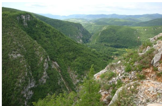
Sl. 5. Dolina Une sa Uncom. Dolina Une je granična rijeka sa unikatnim sedrenim kaskadama. Ona pripada turističkom prekograničnom pojasu.

Fig.5. Una valley with Unac. The Una Valley is a border river with unique calcareous sinter cascades. It belongs to the tourist cross border zone.